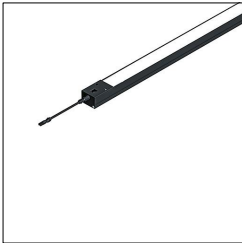
Module d'éclairage à LED SUI TID L1300 2200-840 300MA 60211046