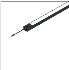
Module d'éclairage à LED SUI TID L1300 2200-840 300MA 60211046

La présente déclaration de produit environnemental (EPD) est basée selon les normes EN ISO 14025 et EN 15804 et décrit les impacts spécifiques environnementaux du produit mentionné. Cette déclaration fait suite également aux exigences spécifiques et concrètes du programme Institut Bauen und Umwelt e.V. (IBU) selon les règles de calcul des LCA et le contenu de l'EPD (de base) selon les instructions de PCR sous-jacentes (PCR: Règles de catégorie de produit) pour «Luminaires, lampes et composants pour luminaires» (Ref: IBU PCR Teil A et B). Le produit décrit sert d'unité déclarée. La déclaration inclut une description du produit, des informations sur la composition des matériaux, la production, le transport, la phase d'utilisation, l'élimination et le recyclage, ainsi que les résultats de l'évaluation du cycle de vie. Les EPD des produits de construction sont comparables uniquement si les valeurs sont calculées conformément au même PCR et des scénarios d'utilisation appropriés et obligatoires.