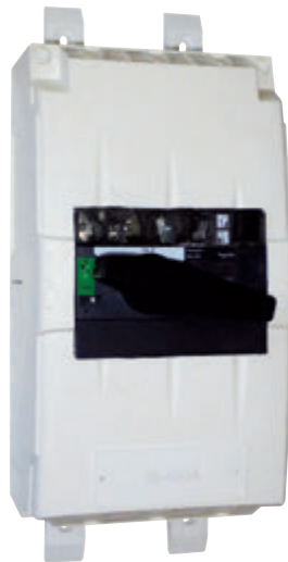
Coffret IS 400A (GE002)