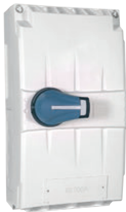
Coffret IS 200A (GE001)