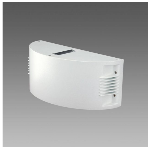
1279 Onda LED