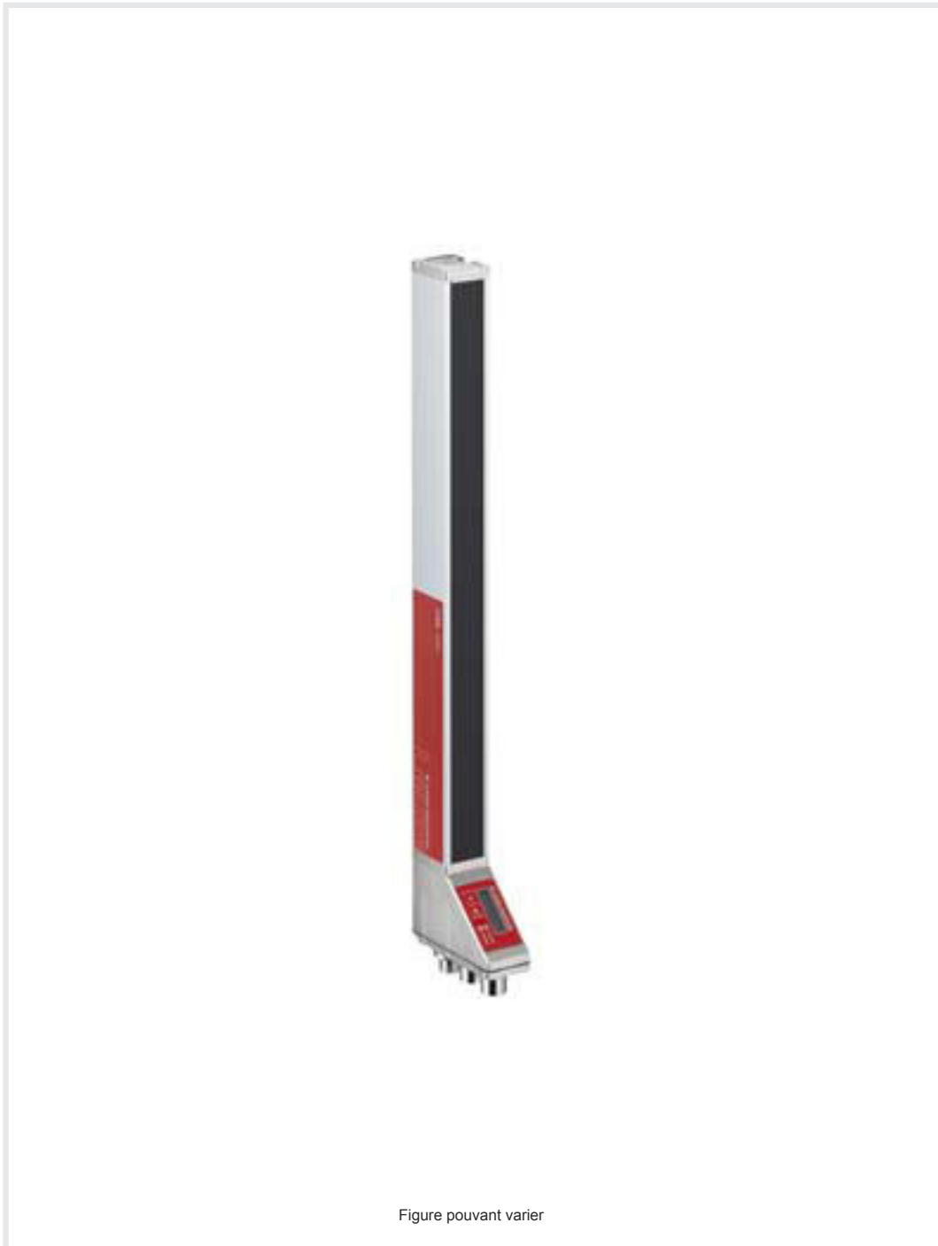
Figure pouvant varier