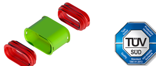
Kit connecteur AE35SC