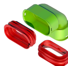
Kit coude vertical AE35SC