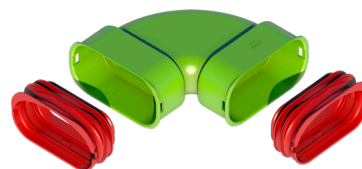
Kit coude horizontal AE35SC

Les kits Air Excellent simplifient le chiffrage d'une installation. Ils comprennent tous les éléments nécessaires pour raccorder les conduits ou tés : joint d'étanchéité, clips de blocage, coudes, connecteurs ... ce qui facilite le dimensionnement d'une installation complète et permet un gain de temps à l'installateur, sans risque de se tromper.