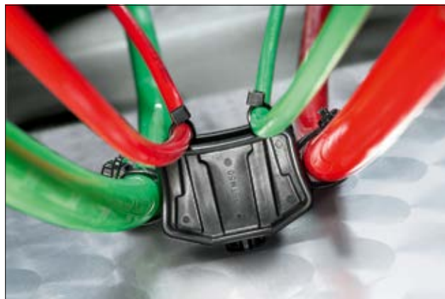
Embase S3STM50, en application.