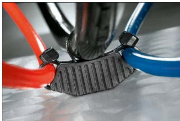
Entretoise MSBT120, en application.