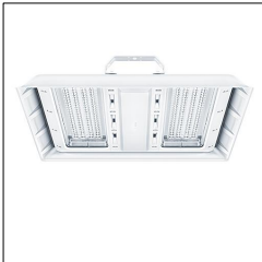
Luminaire industriel à LED CR2 M13k-840 PC WB EVG WH 42187626