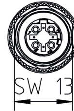
Schéma des pôles