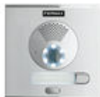
F40708 PLATINE CITY S1 CP101 DUOX PLUS