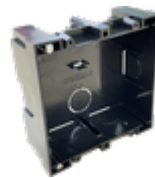
F08948 BOÎTIER ENCASTRABLE KIT S/1