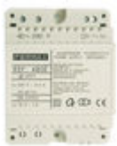
F04802 ALIMENTATION DIN4 230VAC/12VAC-1A