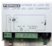
F02438 ACTIVATEUR SONNETTE OU ECLAIRAGE VDS