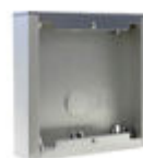
F07061 BOÎTIER EN SAILLIE CITY S1