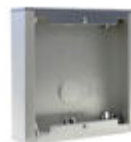
F07061 BOÎTIER EN SAILLIE CITY S1