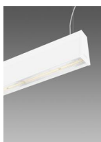
Sintesi System - en suspension éclairage direct indirect - extensif 60° - UGR<22