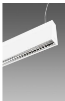
Sintesi System - en suspension éclairage direct indirect - optique basse luminance - UGR<19