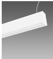
Sintesi System - en suspension éclairage direct indirect - extensif