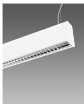
Sintesi System - en suspension - optique basse luminance - UGR<19