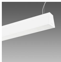
Sintesi System - en suspension - avec diffuseur UGR<19