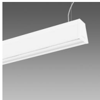
Sintesi System - en suspension - extensif