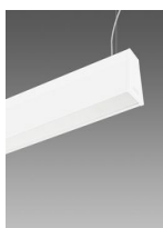
Sintesi System - en suspension éclairage direct indirect - avec diffuseur UGR<19