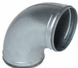
Coude 90° à joints

Le coude 90° à joints permet de changer la direction d'un réseau galvanisé de 90° tout en assurant une étanchéité classe C.