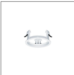
Anneau d'encastrement CAR EVO M R1 RING WH 60800826