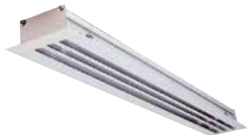
ALD614 1150 ALU + DAMPER

Le ALD 610 - 620 est un diffuseur linéaire en aluminium à fentes fixes pour la diffusion ou la reprise d'air dans les bâtiments tertiaires.