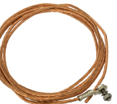
25 HURK V10X 2505