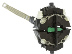
Version Tétrapolaire TTDS 4-05 I