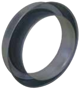
Réduction Plate Concentrique

La RPC permet de raccorder deux conduits galvanisés de diamètres différents entre eux sur un minimum de longueur.