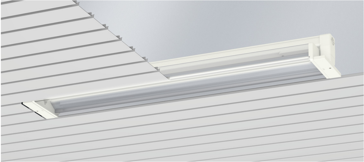
L'illustration peut différer