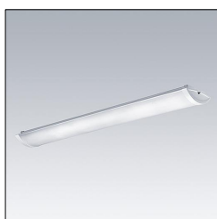
Plafonnier LED PRISMA LED4400-840 HF FR L1200 TW 96630828

La présente déclaration de produit environnemental (EPD) est basée selon les normes EN ISO 14025 et EN 15804 et décrit les impacts spécifiques environnementaux du produit mentionné. Cette déclaration fait suite également aux exigences spécifiques et concrètes du programme Institut Bauen und Umwelt e.V. (IBU) selon les règles de calcul des LCA et le contenu de l'EPD (de base) selon les instructions de PCR sous-jacentes (PCR: Règles de catégorie de produit) pour «Luminaires, lampes et composants pour luminaires» (Ref: IBU PCR Teil A et B). Le produit décrit sert d'unité déclarée. La déclaration inclut une description du produit, des informations sur la composition des matériaux, la production, le transport, la phase d'utilisation, l'élimination et le recyclage, ainsi que les résultats de l'évaluation du cycle de vie. Les EPD des produits de construction sont comparables uniquement si les valeurs sont calculées conformément au même PCR et des scénarios d'utilisation appropriés et obligatoires.