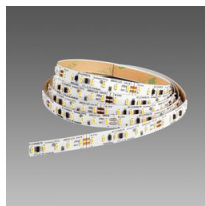
Strip - LED 24V - CRI>90