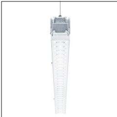
Réglette à LED pour chemin lumineux TECTON MIREL LED3700-840 L1000 LDO WH 42185317