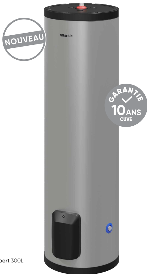
Inox Expert 300L

Robuste et durable il a été conçu pour répondre aux besoins en eau chaude sanitaire intensifs des professionnels. Inox Expert est adapté à tous les types d'eau et aux milieux difficiles.