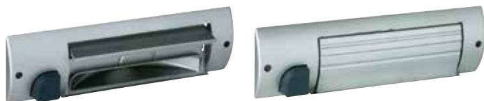
Plinthe ramasse-miette argent - volet ouvert

La solution discrète pour évacuer les poussières d'une cuisine ou d'une entrée.