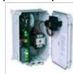
Ouvert, avec interrupteur et pressostat