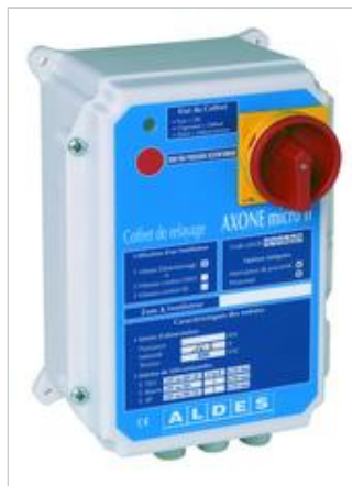
Fermé, avec interrupteur et pressostat