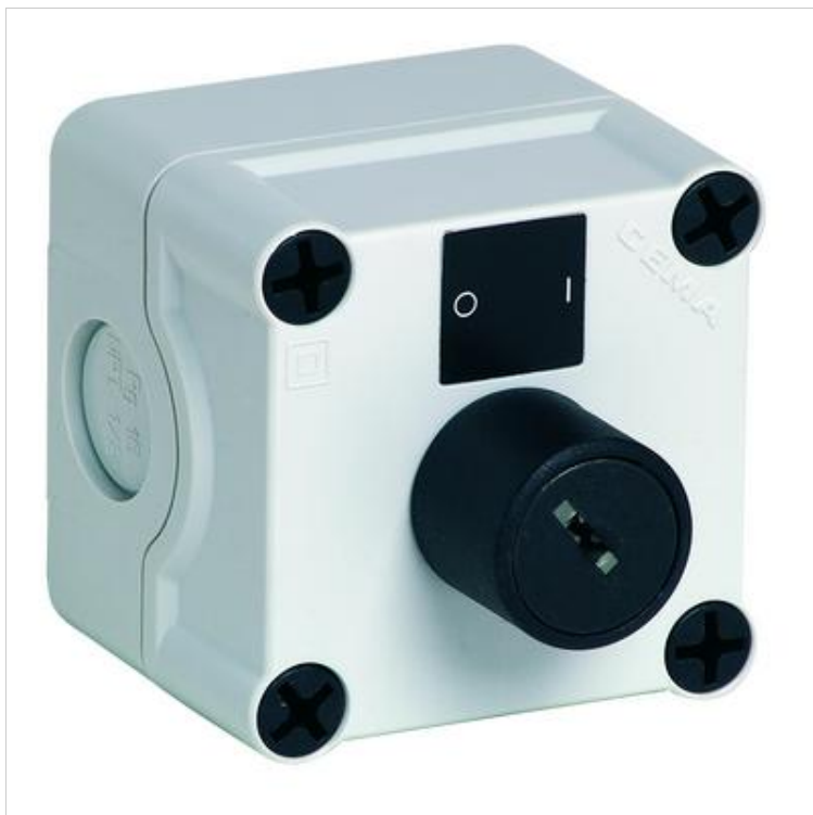
Boitier Arrêt Pompier