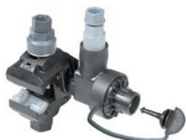
NTD 50-35 AFA

Clé de maintien ( KJ 17 M ). Code produit : 1 000 007 853) : facilite le maintien du connecteur pendant le serrage.