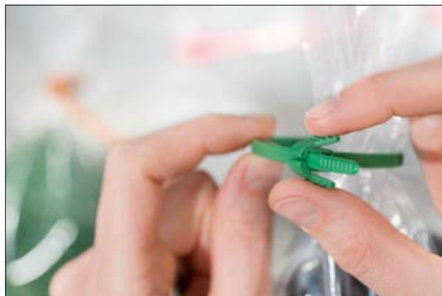
Collier de la série REZ avec un mécanisme de réouverture facile par pincement.