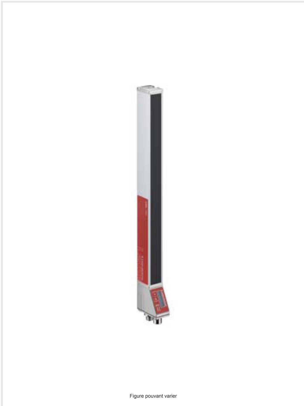
Figure pouvant varier