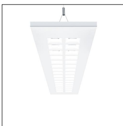
Luminaire suspendu à LED MIRL DI LED3000-830 WB LDO WH ASQ1 42928693

La présente déclaration de produit environnemental (EPD) est basée selon les normes EN ISO 14025 et EN 15804 et décrit les impacts spécifiques environnementaux du produit mentionné. Cette déclaration fait suite également aux exigences spécifiques et concrètes du programme Institut Bauen und Umwelt e.V. (IBU) selon les règles de calcul des LCA et le contenu de l'EPD (de base) selon les instructions de PCR sous-jacentes (PCR: Règles de catégorie de produit) pour «Luminaires, lampes et composants pour luminaires» (Ref: IBU PCR Teil A et B). Le produit décrit sert d'unité déclarée. La déclaration inclut une description du produit, des informations sur la composition des matériaux, la production, le transport, la phase d'utilisation, l'élimination et le recyclage, ainsi que les résultats de l'évaluation du cycle de vie. Les EPD des produits de construction sont comparables uniquement si les valeurs sont calculées conformément au même PCR et des scénarios d'utilisation appropriés et obligatoires.