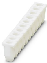
Manchon isolant, coloris: blanc

https://www.phoenixcontact.com/fr/produits/3206131