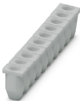
Manchon isolant, coloris: gris

https://www.phoenixcontact.com/fr/produits/3031034