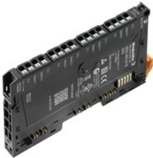
Illustration du produit, Similaire à l'illustration