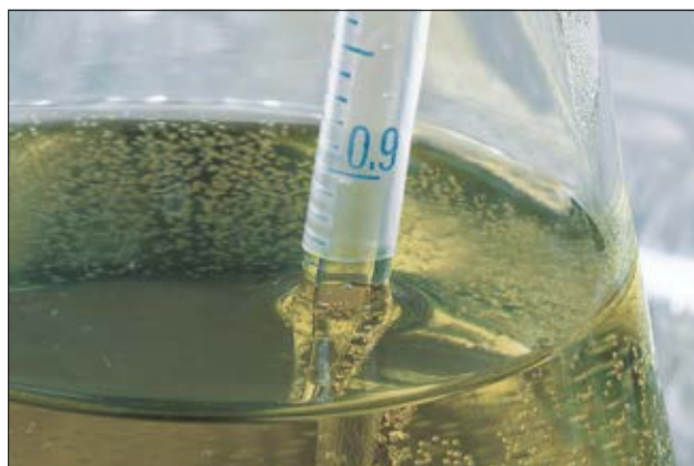
La gaine thermorétractable TK20 est utilisée pour des applications chimiques.