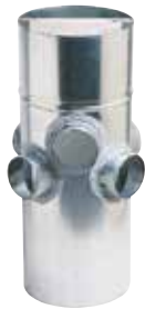
Collecteur Raccord d'Etage multilogement

Le CRE multi-logement permet de raccorder deux logements d'un même niveau sur une même colonne verticale.