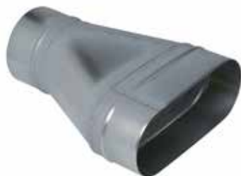
Réduction Oblongue Cylindrique Tangentielle sur Plat

La ROCTP permet de raccorder un réseau oblong à un réseau circulaire tout en conservant un réseau linéaire et plat, sans perte de place vers le bas.