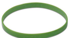
Détrompage couleur, coloris: vert

https://www.phoenixcontact.com/fr/produits/1620588