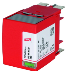
Illustrations sans engagement