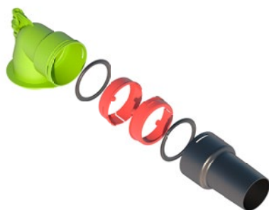
Kit té 90° AE48C pour bouche D80