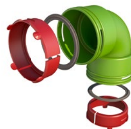
Kit coude AE48C