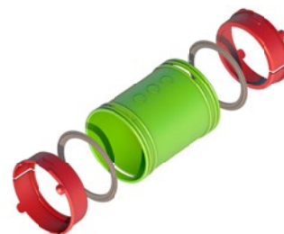
Kit connecteur AE48C