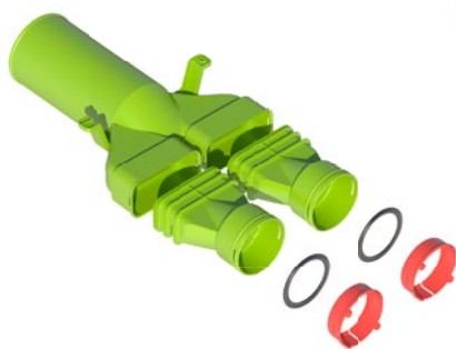
Kit té 180° AE48C