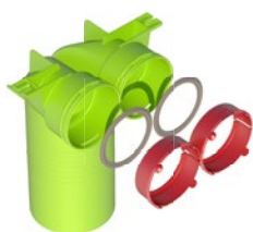
Kit té 90° AE48C pour bouche D125

Les kits Air Excellent simplifient le chiffrage d'une installation. Ils comprennent tous les éléments nécessaires pour raccorder les conduits ou tés : joint d'étanchéité, clips de blocage, coudes, connecteurs ... ce qui facilite le dimensionnement d'une installation complète et permet un gain de temps à l'installateur, sans risque de se tromper.