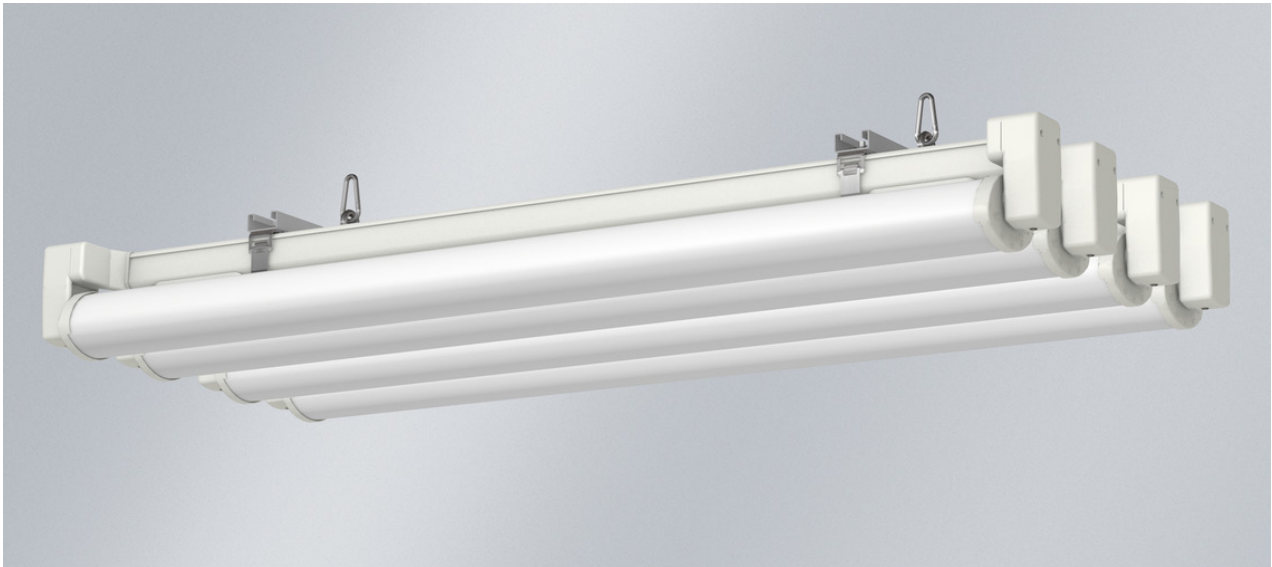
L'illustration peut différer