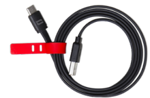
CABLE USB-A / USB-C