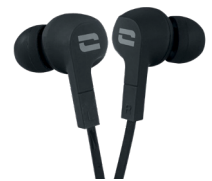
ÉCOUTEURS ÉTANCHES IPX6