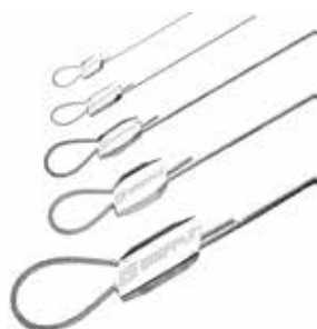
Câbles de suspension rapide