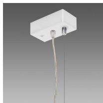
Suspension électr. WIRELESS - 5 pôles