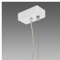
Suspension électrifiée - 5 pôles