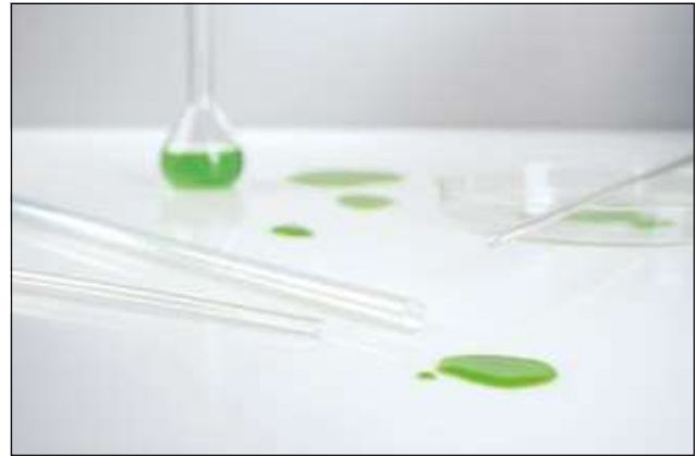
Les gaines TFE sont disponibles en 2 versions (2:1 ou 4:1).