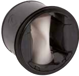
MR Mono HP

Le MR Mono est un régulateur de débit garantissant un débit stable à haute pression pour maîtriser QAI, confort et économie d'énergie du local.