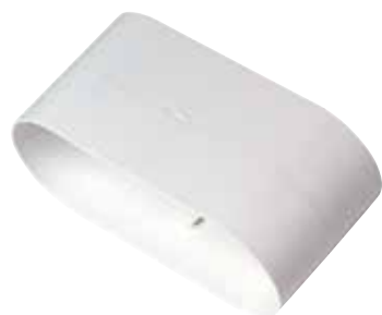
Raccord femelle 40x100 mm