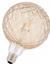
80100040601 LED FIL Pine G125 E27 DIM 3W (18W) 170lm 920 Or