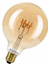
145017 SPIRALED Leslie G125 E27 DIM 3.2W 180lm 919 Or