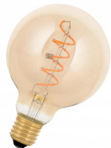
145015 SPIRALED William G95 E27 DIM 3.2W 180lm 919 Or