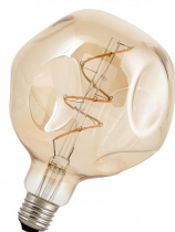
80100040744 LED Big Baby G125 E27 DIM 3W (15W) 140lm 920 Or