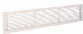
Grille Gridlined wall

La grille murale intérieure fixe en aluminium GRIDLINED Wall est destinée au soufflage et à la reprise de l'air dans les bâtiments tertiaires.