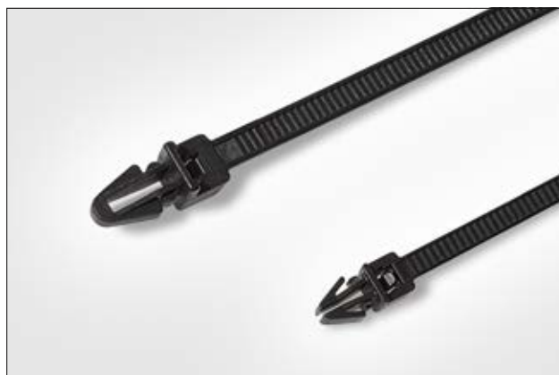
Lanières monoblocs avec pied ancre sans jupe ni ailette.