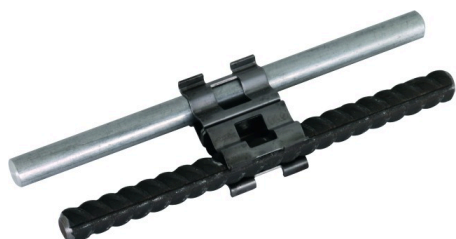
Illustrations sans engagement