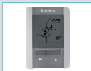
Télécommande 4 vitesses radio (11023226)