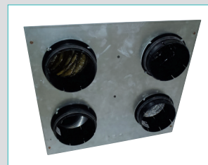
Nourrice passage plafond (11023224)