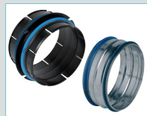
Raccords (11023209 / 11098163)