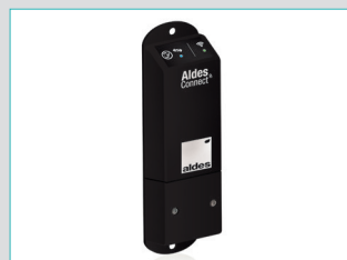
AldesConnect™ Box Modem