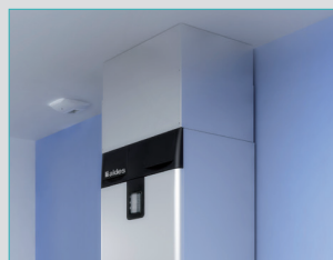
Cache-gaine télescopique (11023223)