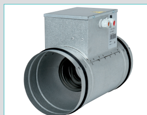
Batterie de préchauffage bus (11023225)