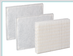
Filtres de rechange 2 G4 + 1 F7 (11023221)