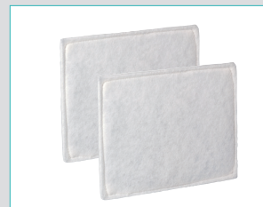
Filtres de rechange 2 G4 (11023220)