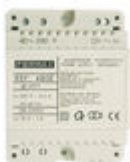
F04802 ALIMENTATION DIN4 230VAC/12VAC-1A