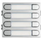
F07371 8 BP. 204 W VDS/BUS2 SKYLINE