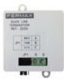
F03255 FIN LIGNE DUOX PLUS