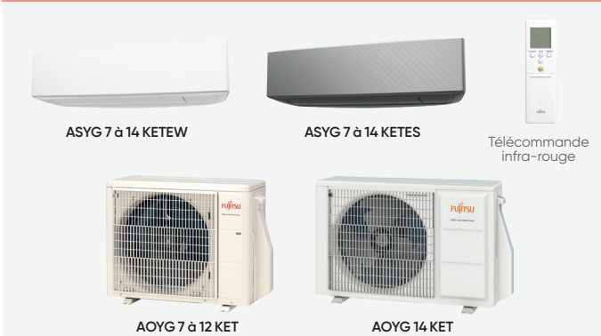
ASYG 7 à 14 KETEW