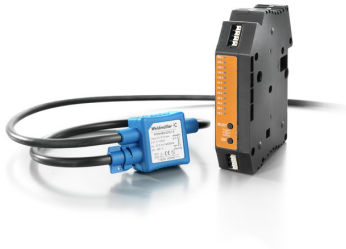
use with Rogowski coil